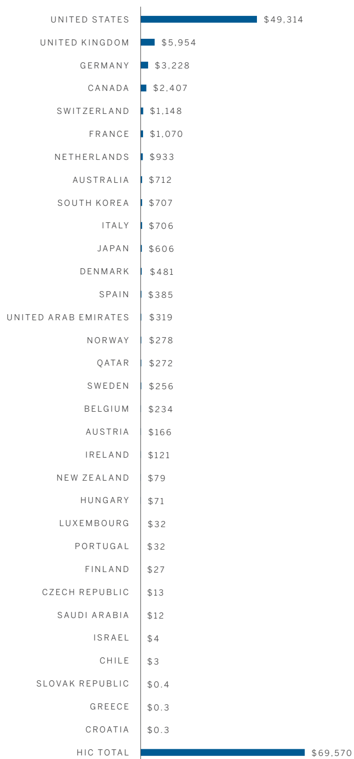
Philanthropic Outflows (in millions of inflation-adjusted 2020 US dollars)